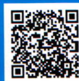
[申し込みフォーム]